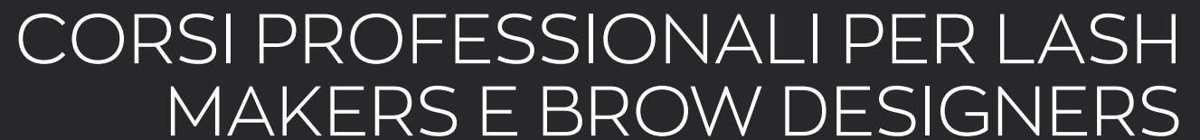
FIGURE PROFESSIONALI ESPERTE NELL'ESTETICA DELLE CIGLIA E SOPRACCIGLIA, UN SETTORE IN COSTANTE CRESCITA.

Un percorso formativo di alta specializzazione che prevede corsi formativi per il design, la cura, l'allungamento e il trattamento delle ciglia e delle sopracciglia.